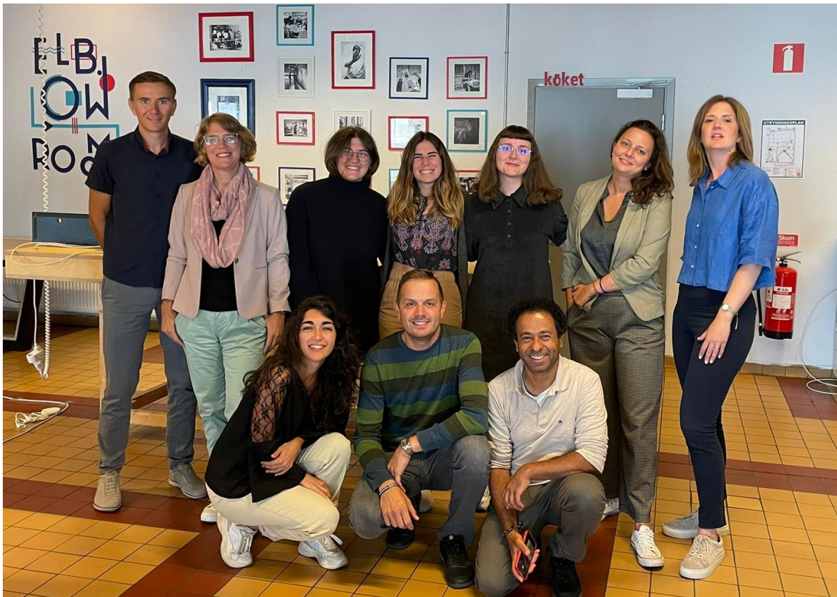
Socios del proyecto CONVOLUT, Malmö, 31 de agosto de 2022